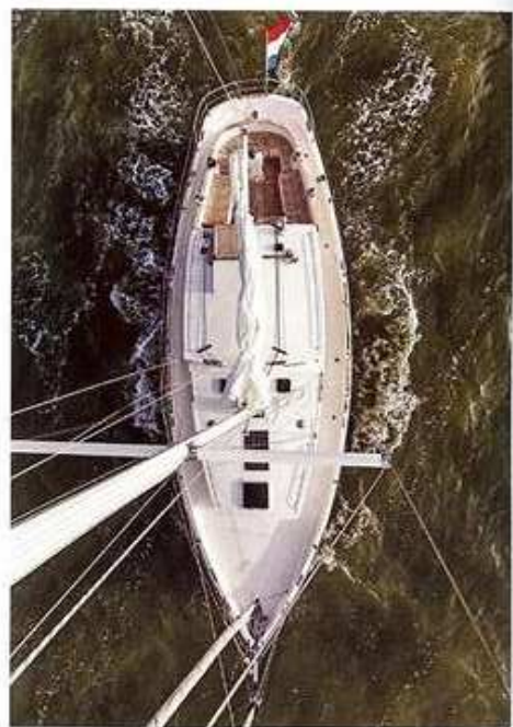
boven: Met het midzwaard omhoog steekt de Wanderer 40P slechts 90 cm en kun je dus varen met 1,20 m water op de plaat...