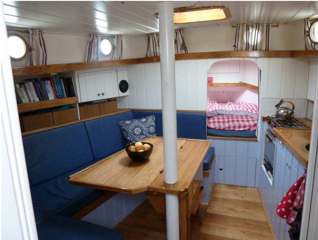
Verrassend veel ruimte en licht benedendeks.

In de zomer van 2007 werd het schip geleverd en konden we zelf aan de slag met de inrichting van de kajuit. Eerlijk gezegd had ik geen ervaring met houtbewerking, maar met tips van kennissen, goed nadenken en gewoon doen, viel het me reuze mee. Sterker nog: we begonnen het steeds leuker te vinden om elk hoekje van het schip helemaal naar eigen idee in te richten. We hebben de Noordkaper ingericht als een visserman, met kraaldelen en Europees eikenhout. En getuigd als een platbodem met bronzen lieren en dekbeslag. Na een jaar hard werken in vakanties en weekeinden, konden we de zomer van 2008 weer het wad op met onze nieuwe boot. Dit jaar is het vijfde seizoen dat we ermee varen en hij bevalt steeds beter. Hoewel we nog steeds genieten van plat- en rondbodems met mooie ronde lijnen en zijwaarden zijn we blij met onze knikspant met midzwaard.