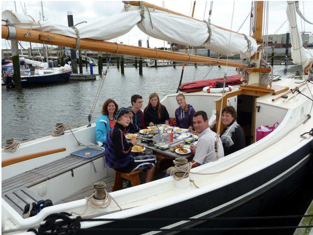
Met de zelflozende vissermankuip is het echt een familieboot.

in de kuip tijdens het zeilen. Nu zijn ze veel vaker buiten, helpen met het zeilen en liggen lekker in de 'middenkuip' te lezen. Of zeilen fanatiek mee in wedstrijden, zoals tijdens de Dutch Classic Yacht Regatta, waaraan we als lid van de Old Gaffers Association Nederland meededen in 2009.