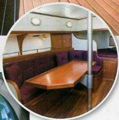
De Noordkaper 31 van binnen. Niet super-de-luxe, maar gewoon netjes. Inclusief een vloer van massief iroko.