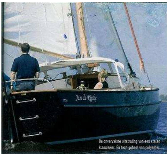
De onvervalste uitstraling van een stalen klassieker. En toch geheel van polyester.