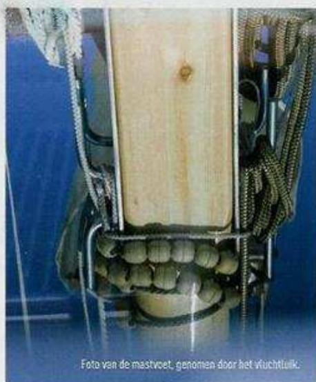
Foto van de mastvoet, genomen door het vluchtluik.