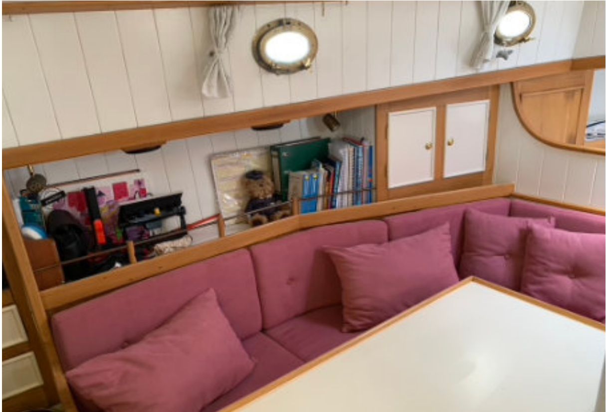
Zithoek, door de tafel te laten zakken, ontstaat nog een slaapplek