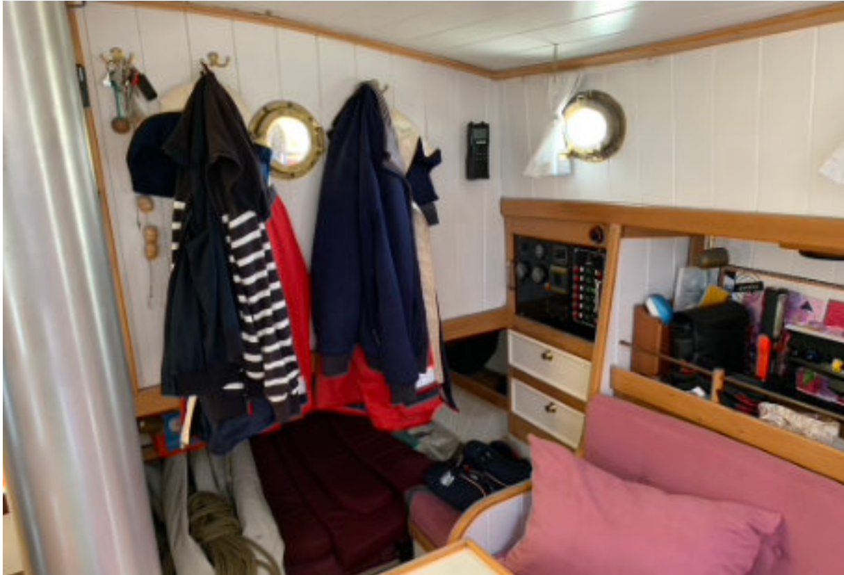
Hondekooi onder de middenkuip