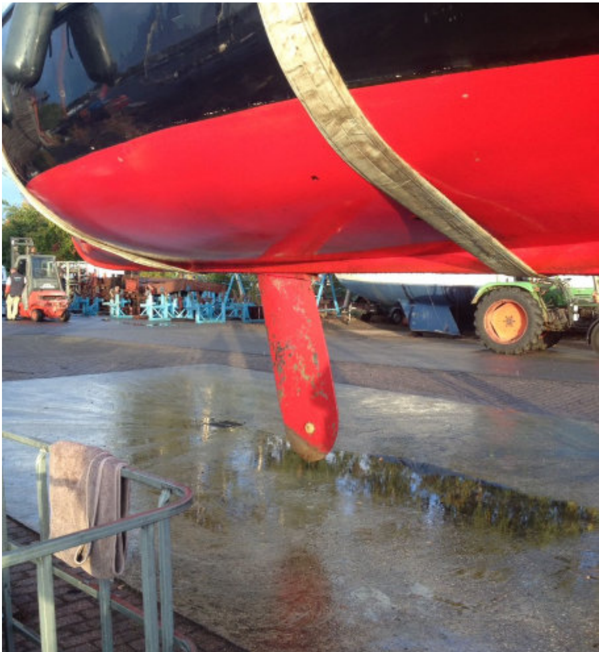
Inspectie van het zwaard, net voor de winterstalling

De boot gaat elk jaar op de kant, tijdens de winterstalling onder een dekkleed. Elk jaar worden alle rondhouten geschuurd en gelakt.