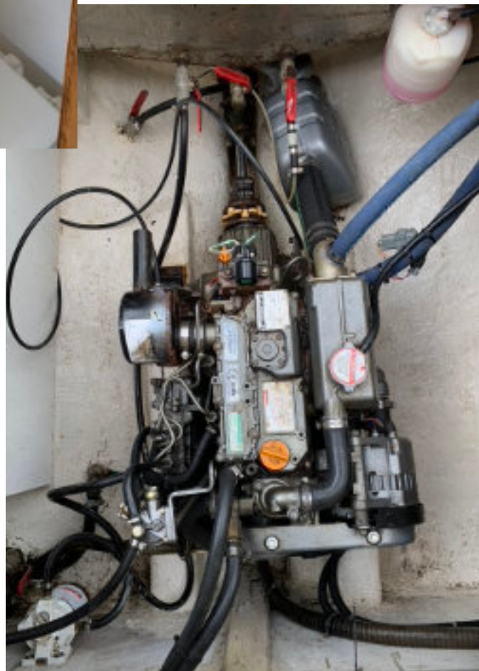
Yanmar 3YM30, 30 pk, Diesel