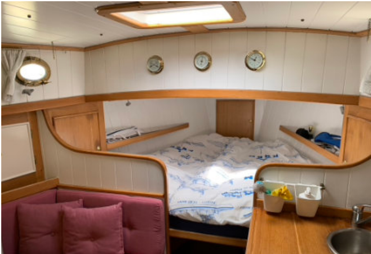
Slaapplaats voorin de piek