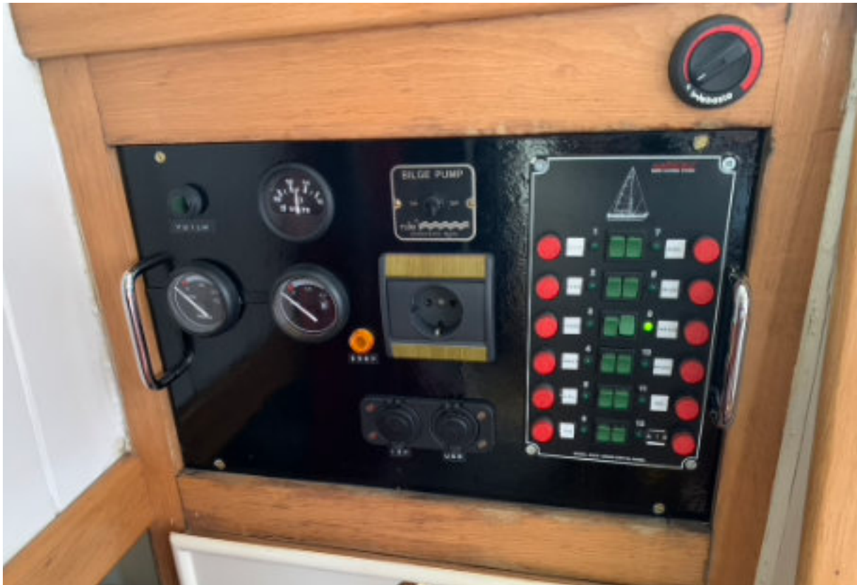
Schakelpaneel in de kajuit met walstroom- en USB-aansluiting