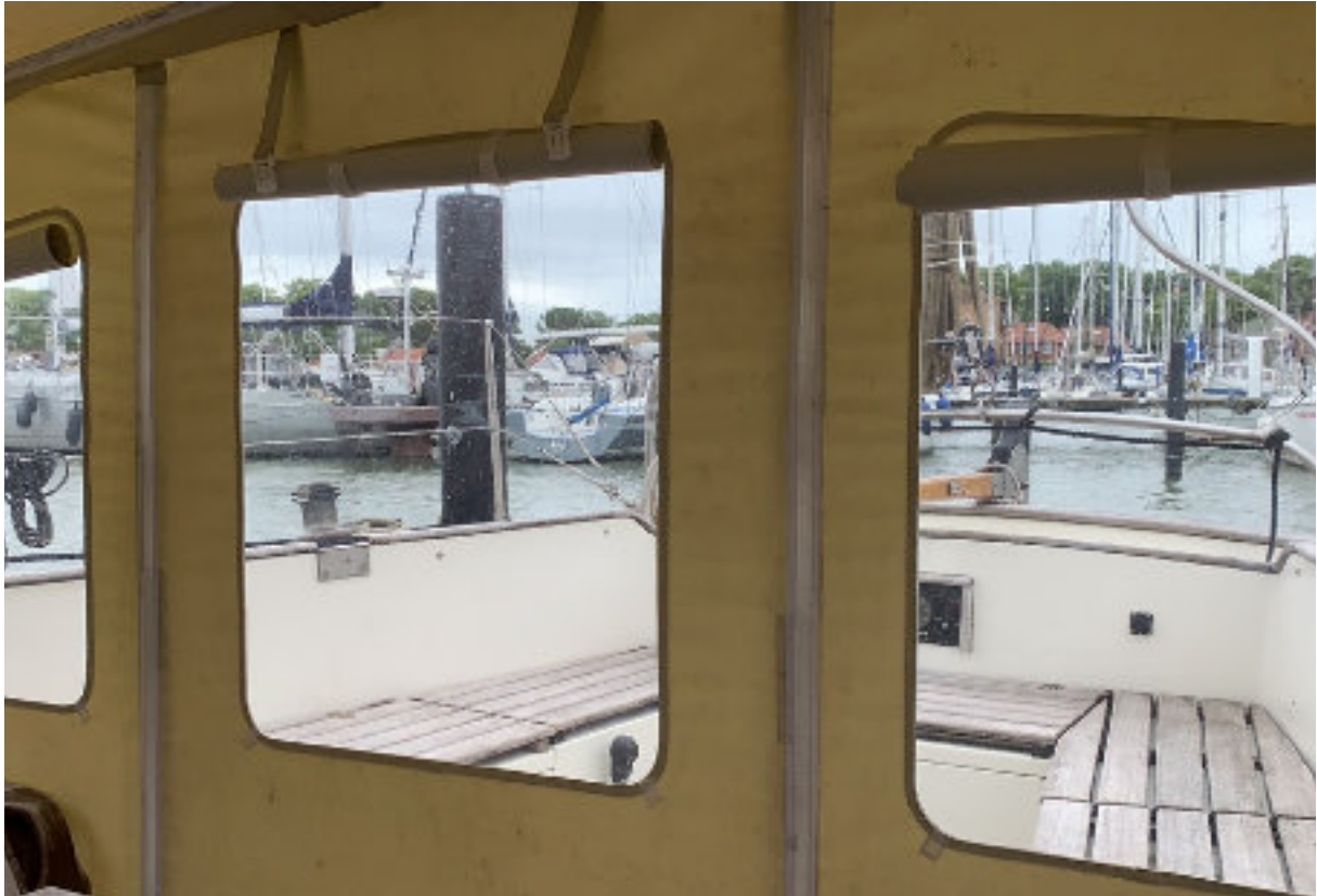
Ook bij minder weer is er goed uitzicht over de haven