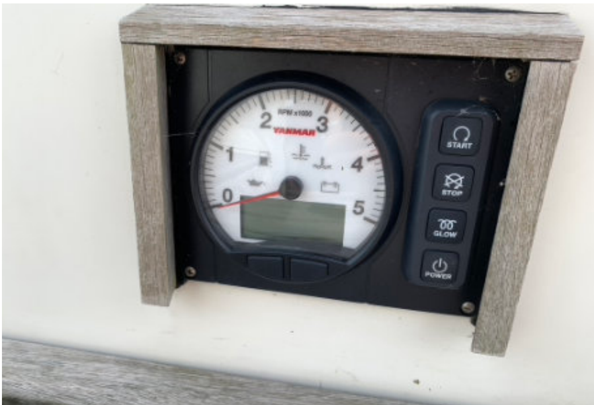
Motorcontrolepaneel in de stuurkuip