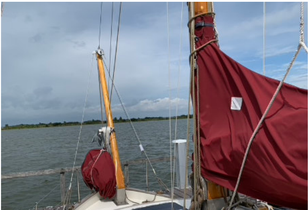
Topbare kluiverboom, rolkluiver (niet aangeslagen), stagfok