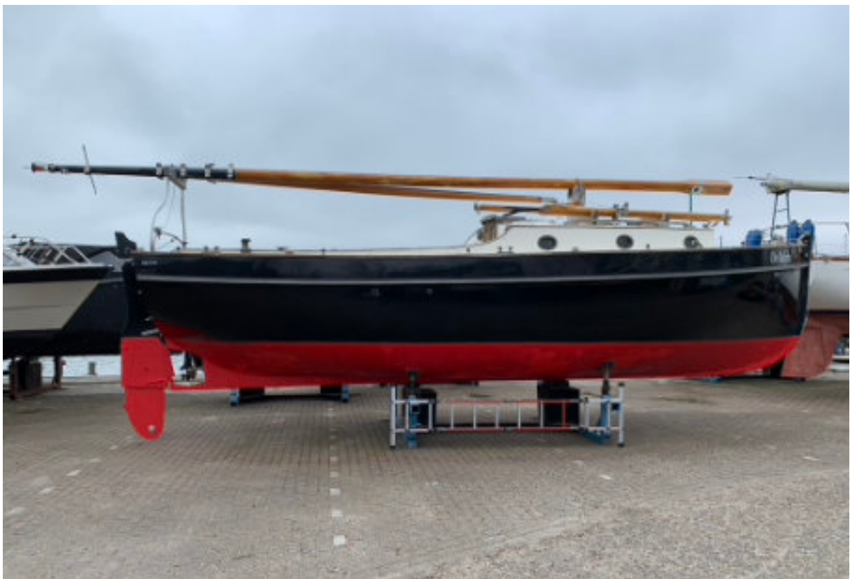
Net voor tewaterlating: het dekzeil eraf om de rondhouten te lakken