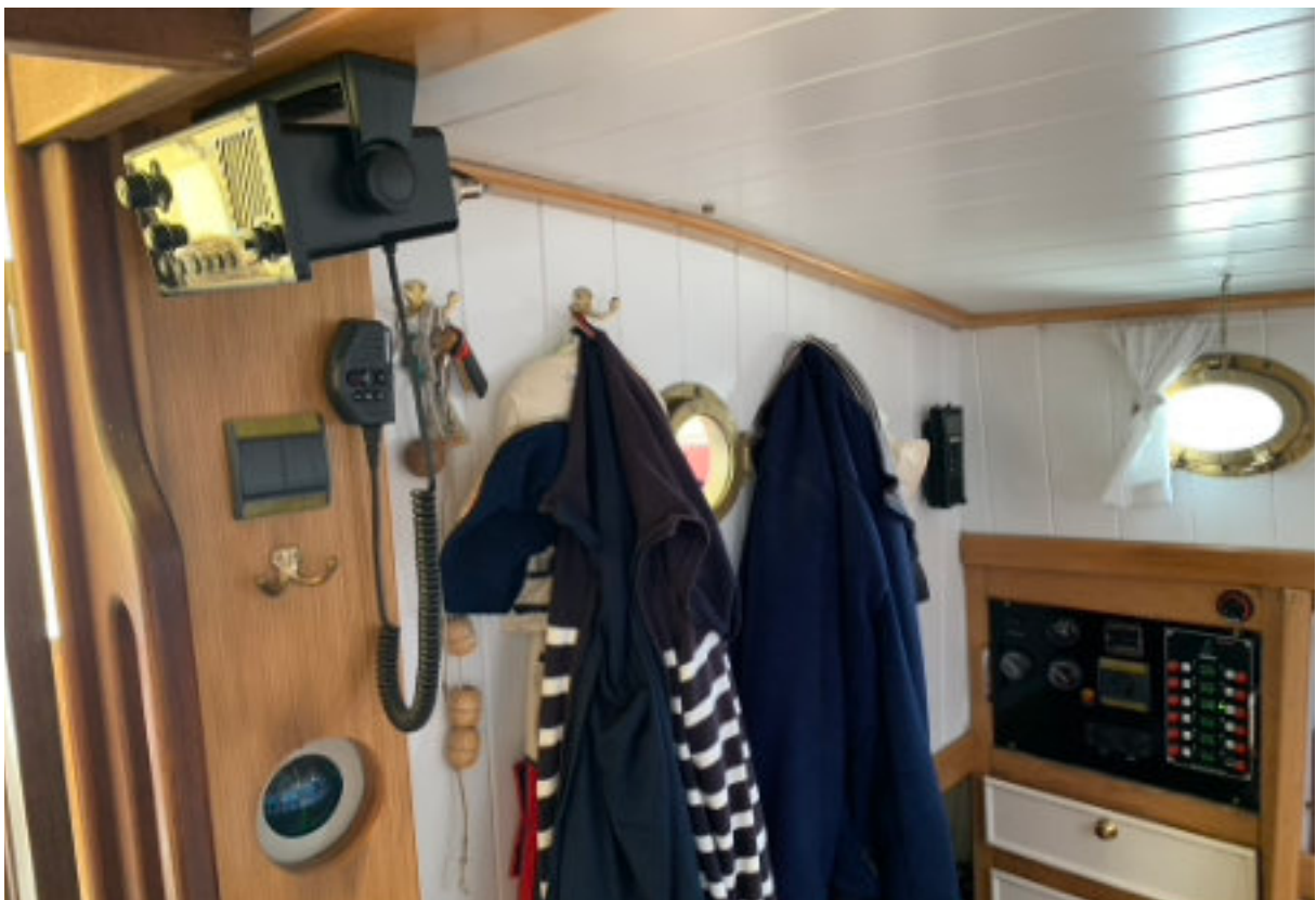
Zeilkleding naast de kajuitingang