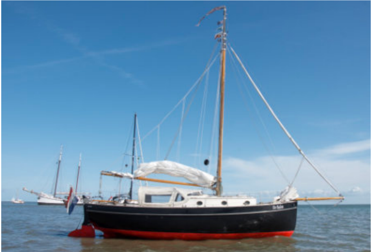
Droogvallen bij de Richel