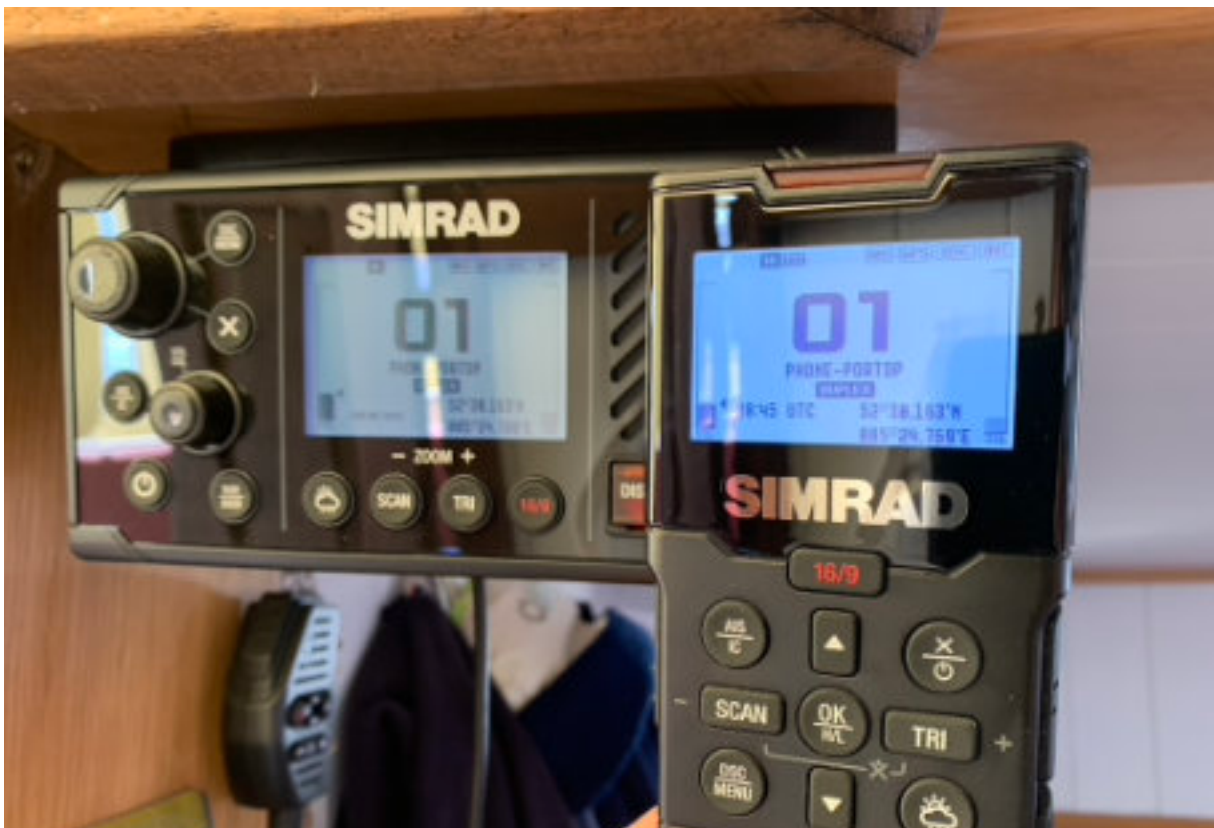
Marifoon, vervangen in 2023