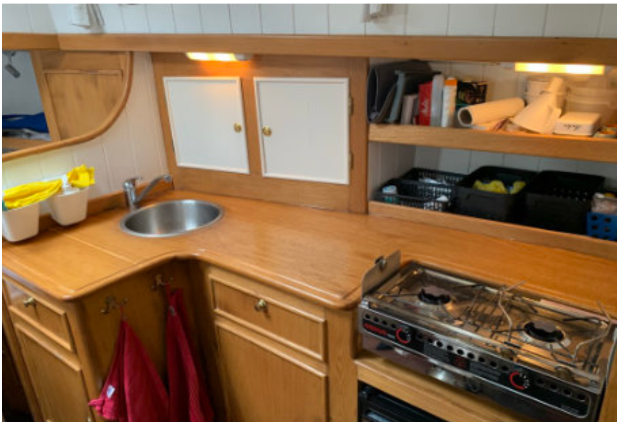
Kombuis met Origo-kooktoestel