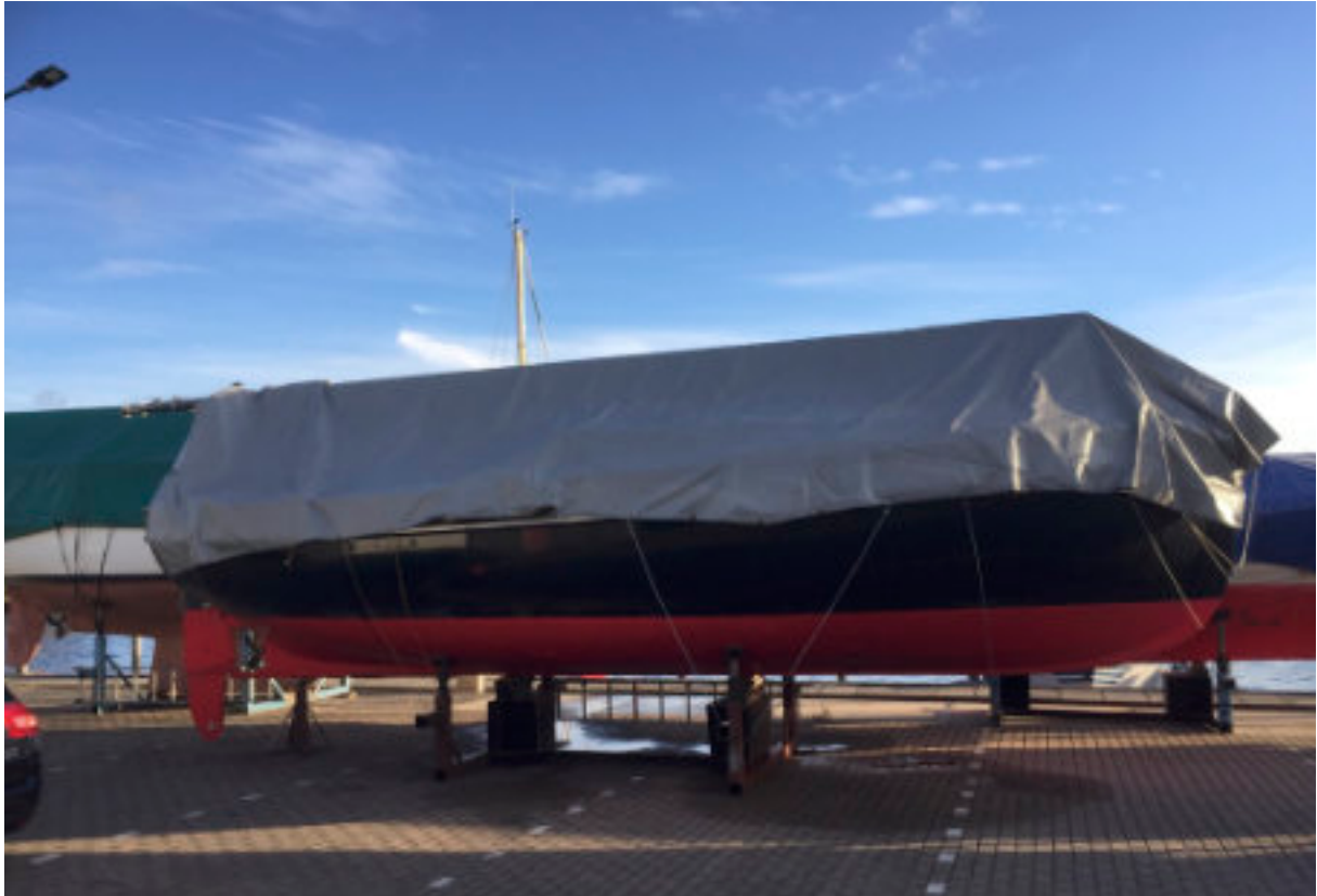
Dekkleed voor de winterperiode