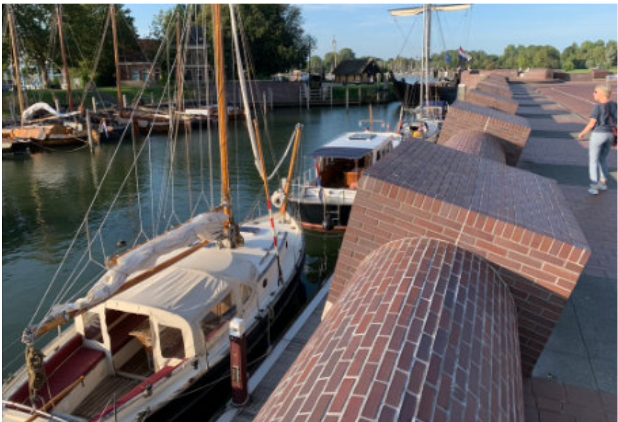
Kuipkussens in zowel middenkuip als stuurkuip