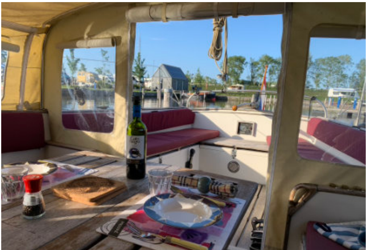
Gezellig tafelen in de middenkuip